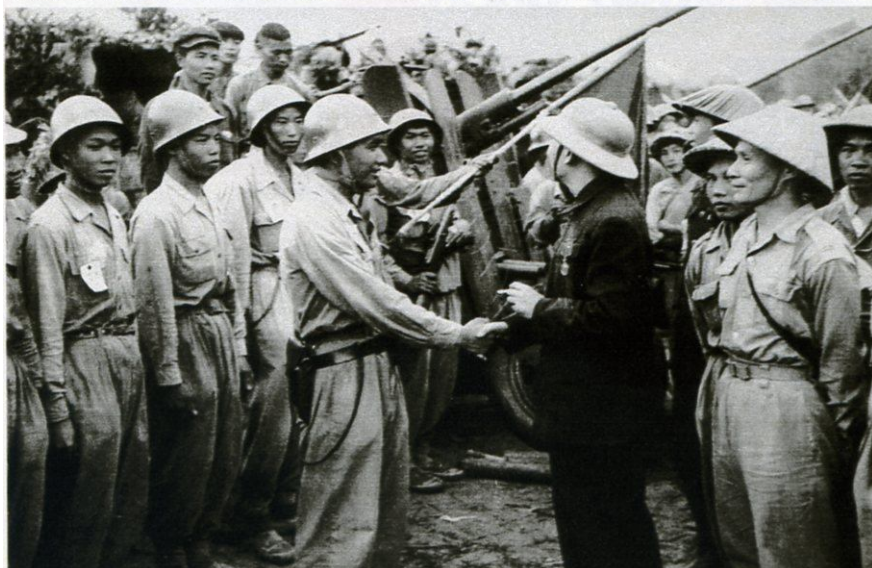
MAGGIO 1954: IL GENERALE GIAP (A DESTRA, VESTITO DI NERO) A DIEN BIEN PHU, DOPO LA VITTORIA SUI FRANCESI

Giap non fu sempre un vincitore, subì anche serie umiliazioni. Fu spesso dato per sconfitto e senza possibilità di riprendersi. Non fu certo un liberale. Il suo irriducibile patriottismo coabitava con lo spirito, puro e duro, del dirigente comunista, pronto a reprimere, con slancio stalinista.